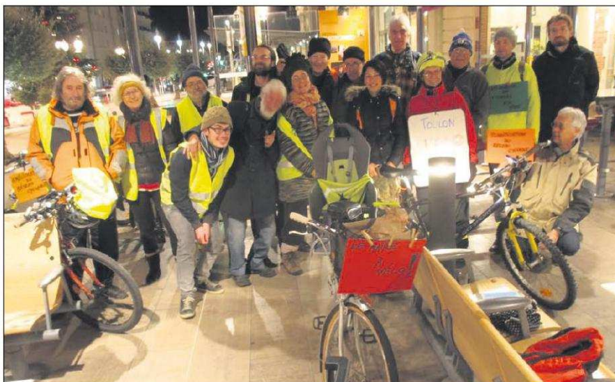
Le collectif cycliste de La Masse critique a lancé, de la gare de Toulon, son appel symbolique pour une promenade urbaine écologique.

52 Le nombre de kilomètres d'itinéraires cyclables sur la commune de Toulon (pistes cyclables, bandes cyclables et espaces partagés).